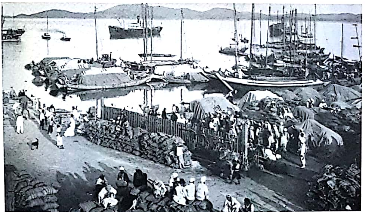
일제강점기 군산항(『일본지리대계』, 1930)

일제는 1899년(광무3) 개항된 군산항을 통해 전북지역에서 생산되는 쌀을 대대적으로 반출해 갔다.