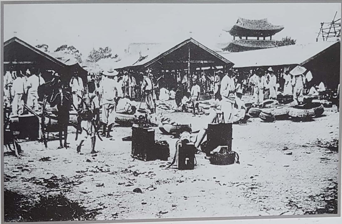
14. 전주 시장 풍경(1930년 무렵)

가운데에 깔려고 내놓은 무쇠솥과 연장들이 늘려 있고 그 왼쪽에 지게꾼들이 서성거리고 있다. 오른쪽의 삿갓 쓴 사람 뒤쪽으로 풍납문이 우뚝 솟아 있다. (『朝鮮의市場經濟』에서)