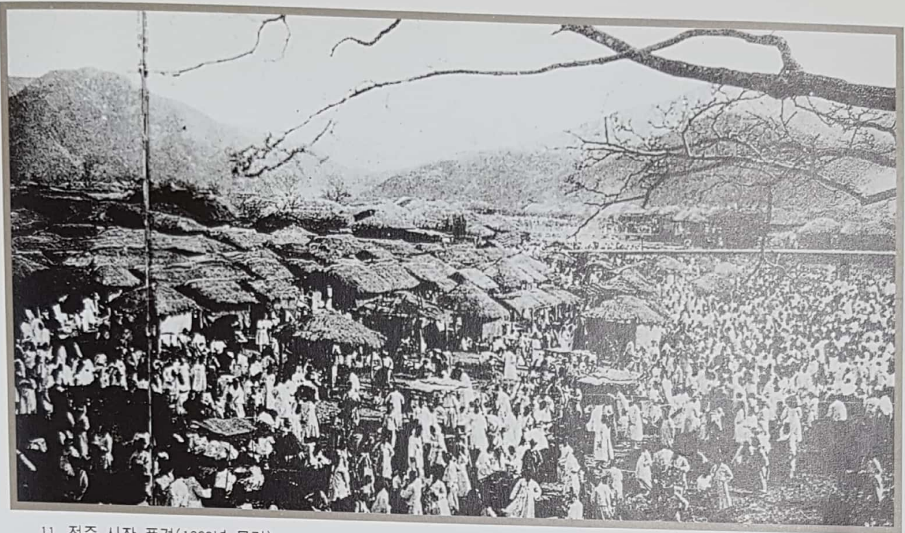
11. 전주 시장 풍경(1930년 무렵)

예로부터 유명한 전주 장날 풍경으로 장날에는 수천명의 장사꾼들이 모여들었고 사람들의 왕래가 빈번했던 장터에서 선교사들은 복음을 전파하기도 하였다. 동학혁명이 일어난 1894년까지 전주 4대문에 장터가 있었으나 그 후 동·북문의 장터는 활기를 잃었고 1923년에는 서문시장마저 남문시장에 흡수되었다. (서문당, 『近代韓國』에서)