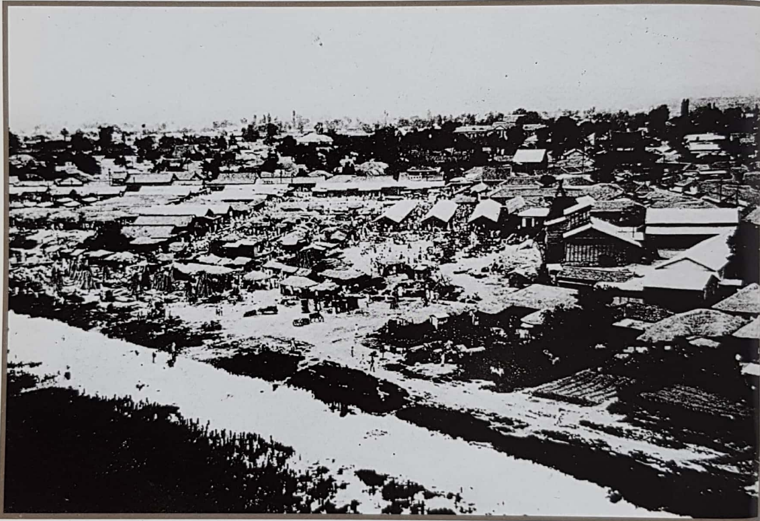
13. 전주 시장 풍경(1930년 무렵) (『朝鮮의市場經濟』에서)