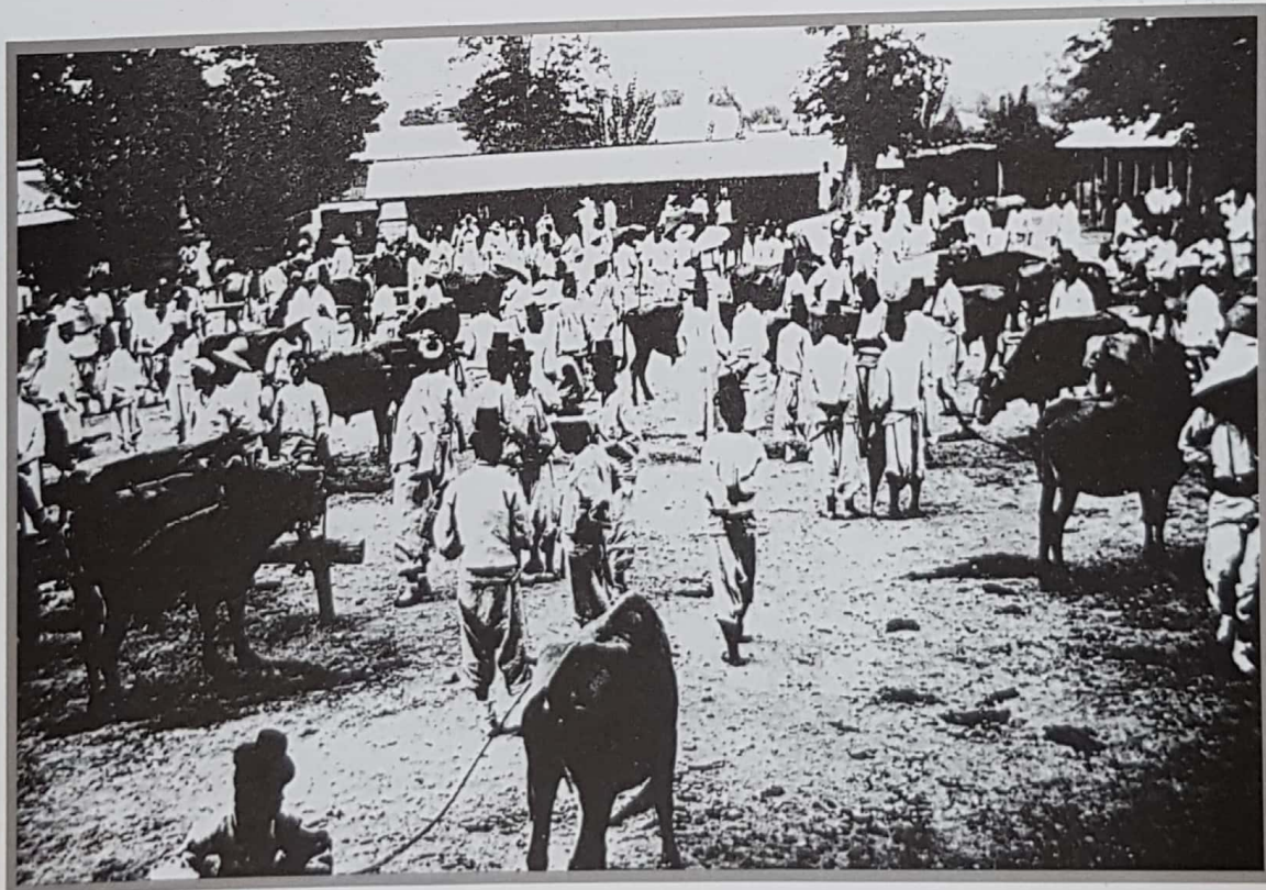
15. 전주 우시장(1930년 무렵)

가운데에 깔려고 내놓은 무쇠솥과 연장들이 늘려 있고 그 왼쪽에 지게꾼들이 서성거리고 있다. 오른쪽의 삿갓 쓴 사람 뒤쪽으로 풍납문이 우뚝 솟아 있다. (『朝鮮의市場經濟』에서)