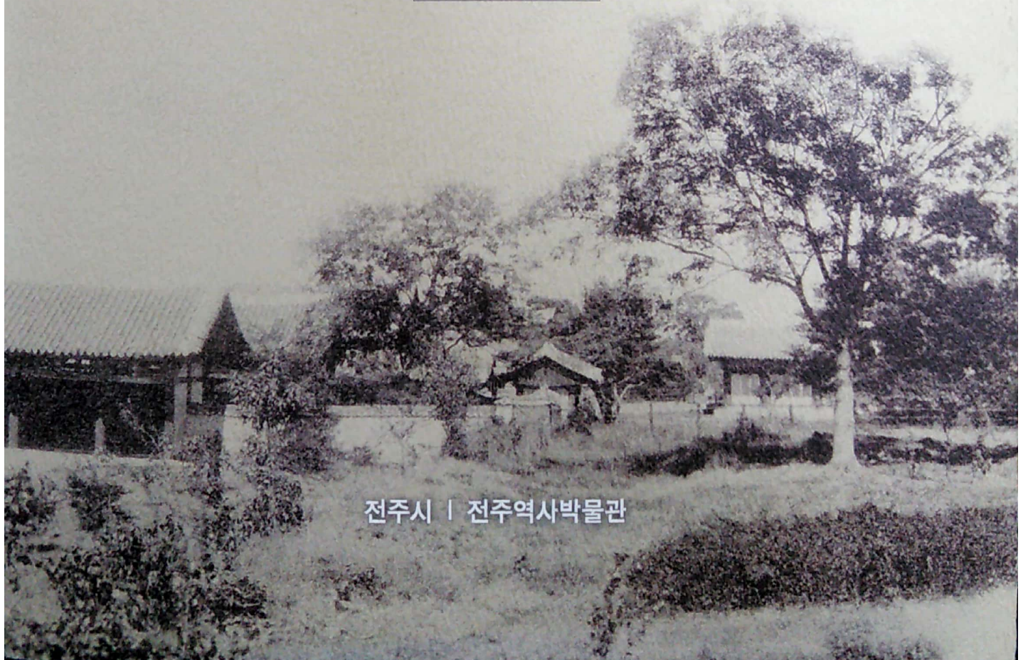
전주시 | 전주역사박물관