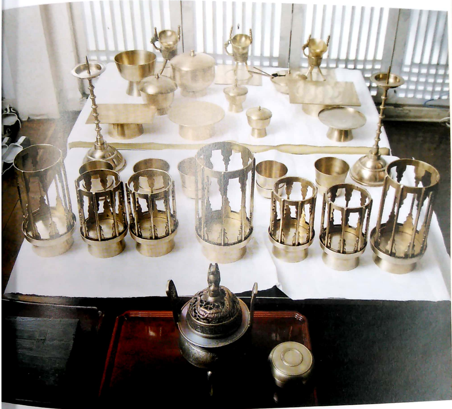
제기 | 경기전